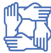
Fondazioni e Associazioni